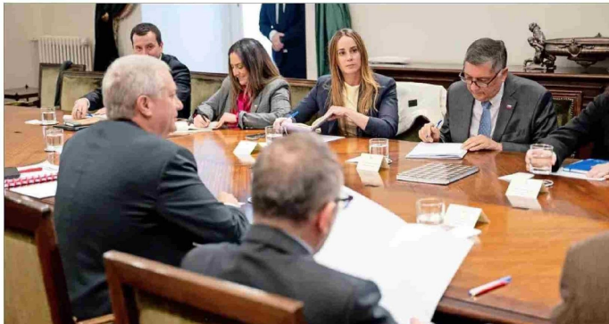
El Presidente Kast lideró el comité político ayer en La Moneda. Más tarde, se realizó la reunión "ampliada" con los partidos del oficialismo.