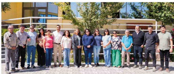
También es un activo participante de la Mesa CAT en representación del Sindicato de Pirquineros.

con cerca de 150 mineros y unas 60 faenas regularizadas, avanzando de forma paralela en la formalización del sector.