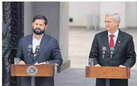
BORIC Y KAST DIERON UNA DECLARACIÓN CONJUNTA.

En esa línea, aprovechó de agradecer la "prudencia" y el espíritu de colaboración de Kast para evitar polémicas en mo-