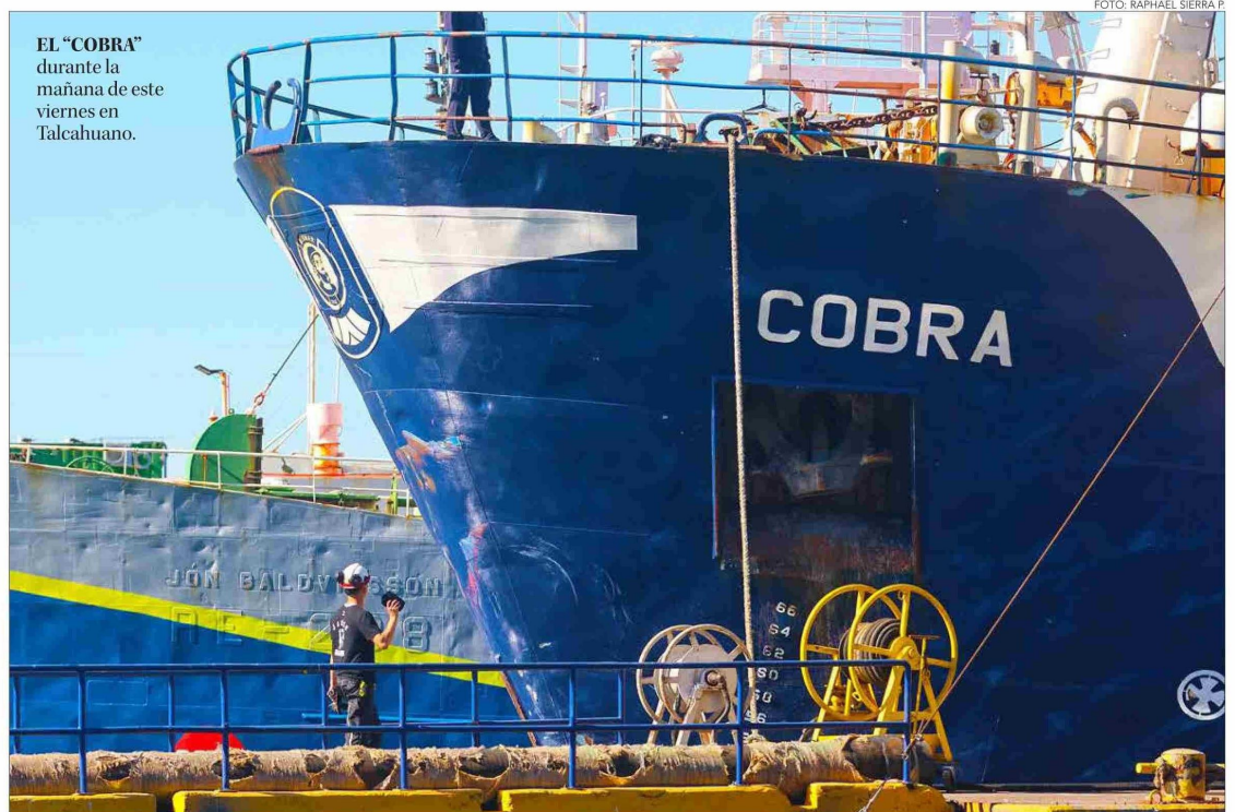
EL "COBRA" durante la mañana de este viernes en Talcahuano.