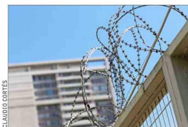
Cárcel de San Joaquín.