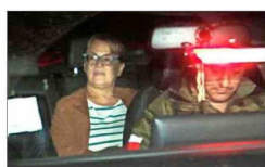
Detención en su casa de Las Condes.

Una chaqueta tapaba sus manos la noche del domingo 25 de enero. Caminaba con cierta dificultad, acompañada de contingente policial, mientras la