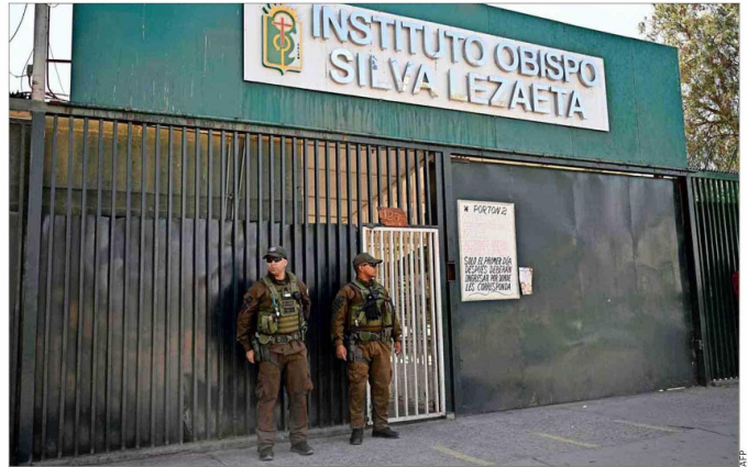
CONMOCIÓN.—El Instituto Obispo Silva Lezaeta permanece sin clases tras el ataque, hace ya 10 días.

“¿Qué hemos hecho para que un joven, en vez de tener sueños, en vez de estar lleno de alegría, en vez de tener proyectos, termina matando? Tenemos que cuestionarnos”.