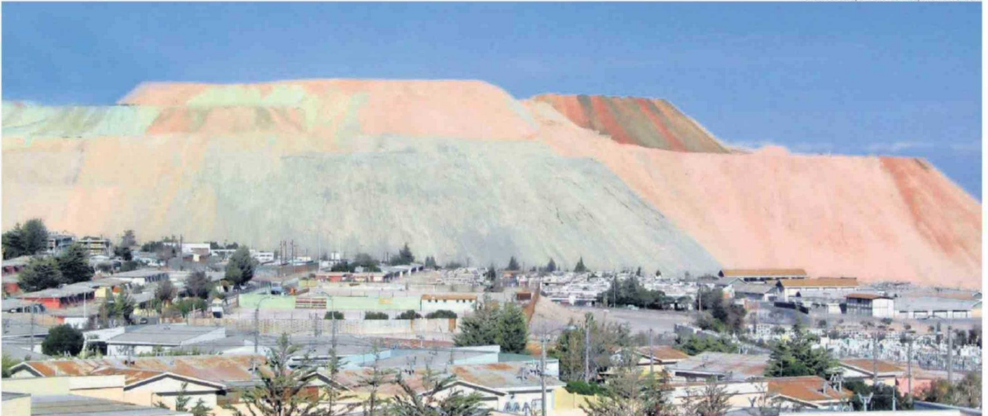
ENTRAÑABLE POSTAL DEL CAMPAMENTO DE CHUQUICAMATA CON SUS CERROS ARTIFICIALES (TORTAS DE RIPIO), LOS CUALES YA HAN IDO TRAGANDO PARTE DE LA HISTORIA DEL LUGAR.