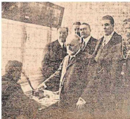
PRESIDENTE BARROS LUCO DANDO LA ORDEN PARA EL FUNCIONAMIENTO DE CHUQUICAMATA EL 18 DE MAYO DE 1915.