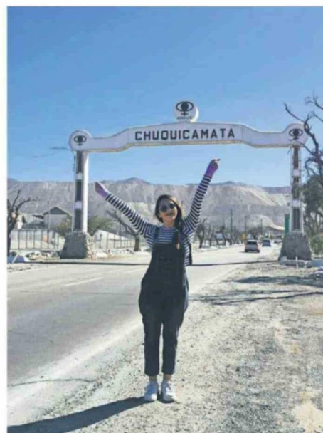
CHUQUICAMATINA TOMÁNDOSE LA TRADICIONAL FOTOGRAFÍA FRENTE AL ARCO DE BIENVENIDA DEL CAMPAMENTO.

Por lo anterior, agregó que "hemos impulsado la recuperación de espacios emblemáticos como el Teatro Chile, el Club Chuqui, la Parroquia El Salvador, el Auditorio Sindical y recientemente el Club Obrero, bajo los lineamientos del Consejo de Monumentos Nacionales. Pero además, creemos que este desafío debe construirse de manera colectiva, por eso seguimos trabajando junto a agrupaciones de ex habitantes y organizaciones patrimoniales para avanzar en una futura Corporación Patrimonial y Cultural Chuquicamata que permita fortalecer su conservación, difusión y desarrollo cultural en el tiempo".