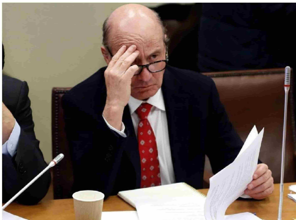
El ministro de Hacienda, Jorge Quiroz, en la jornada de este miércoles en el Congreso.

La norma permite a las empresas que tengan contratados trabajadores que reciban remuneraciones entre 7,8 UTM y 12 UTM, obtener un crédito tributario, descontado a través de los PPM o del IVA, lo que en la práctica les significaría reducir