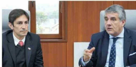
A NIVEL REGIONAL SE REALIZÓ EL ANÁLISIS DEL PROYECTO.

En la instancia, se dio cuenta de que uno de los principales impactos del proyecto será la reducción en el costo del servicio para