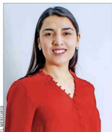
Judith Marín , quien asumirá como ministra de la Mujer el 11 de marzo.

El martes, apenas una hora después del anuncio del futuro gabinete del Presidente electo, José Antonio Kast, la Coordinadora Feminista 8M —una de las principales organizaciones a cargo de la conmemoración del Día Internacional de la Mujer— arremetió contra la designación de la evangélica, exconcejala de San Ramón y militante del Partido Social Cristiano, Judith Marín, como ministra de la Mujer.