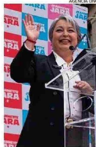
SEMINARIO SERÁ EL MARTES.