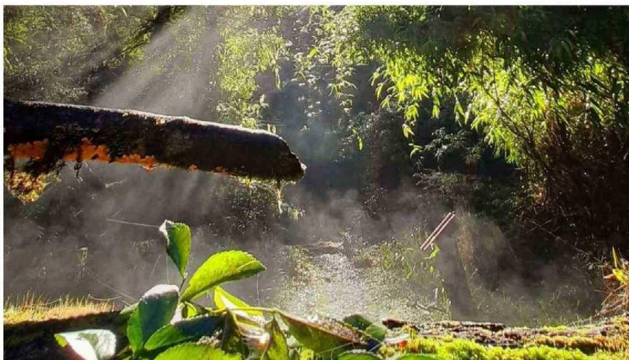
LA BELLEZA PAISAJÍSTICA AL INTERIOR DE RUCAMANQUE SORPRENDE AL VISITANTE.

Tiraje: 8.000 Lectoría: 16.000 Favorabilidad: No Definida