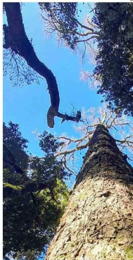
DECENAS DE ESPECIES DE FLORA Y FAUNA NATIVAS SE HALLAN AL INTERIOR DEL PARQUE. EL CHUCAO ES EL PRIMERO EN RECIBIR A LOS VISITANTES.

Una vez allí, se dimensiona la riqueza biológica, histórica y paisajística que esconde este rincón de Temuco, que ade-