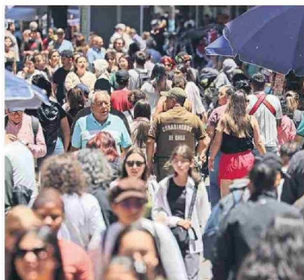
RUF es un componente esencial de la agenda de seguridad de Boric.

efectos que tendrá en los planteles, en especial en los privados.