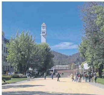
El proyecto FES ingresó en octubre de 2024 al Congreso.