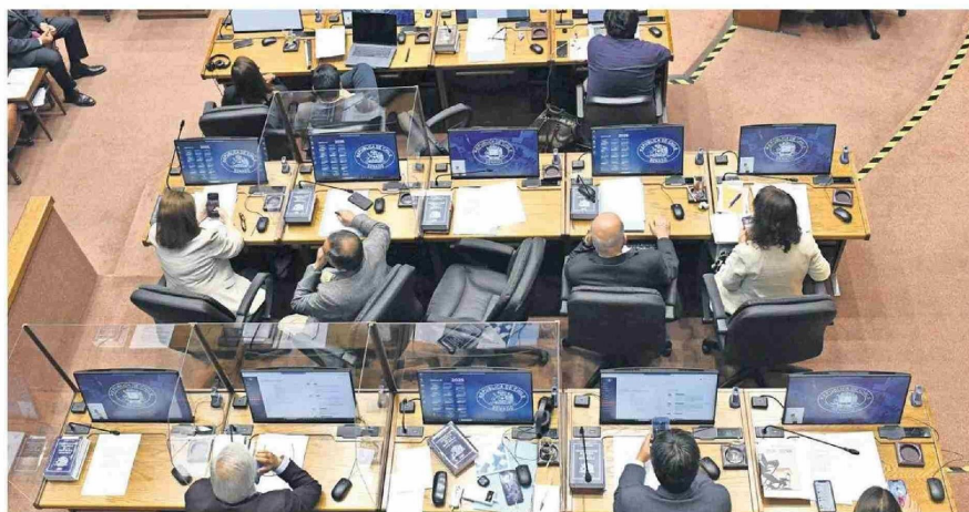
Varias de las medidas mencionadas por los senadores se encuentran aún en una primera etapa constitucional.

Por Nicolás Arrán Álvarez / nicolas.alvarez@diariobioesudo.cl