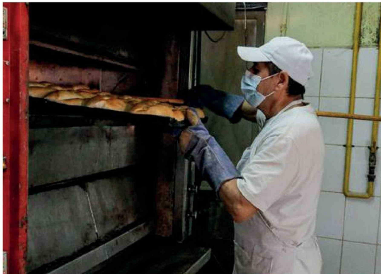
SECTOR DE PEQUEÑAS Y MEDIANAS EMPRESAS concentra una parte relevante del empleo formal y ha advertido efectos del proyecto en su carga tributaria futura.

Desde la entidad también señalaron que el escenario actual de las empresas de menor tamaño es complejo, con dificultades para sostener su operación y un contexto económico que no favorece su crecimiento, por lo que advirtieron que medidas de este tipo podrían profundizar esas condiciones.