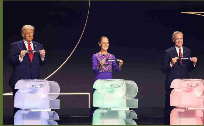
El presidente de Estados Unidos, Donald Trump (i), la presidenta de México, Claudia Sheinbaum (c), y el primer ministro de Canadá, Mark Carney, sostienen papeles con los nombres de sus países durante el sorteo del Mundial de Fútbol FIFA 2026 celebrado en el Kennedy Center de Washington el pasado 5 de diciembre.

Departamento de Seguridad Nacional anunció en enero, a través de un comunicado, que planean invertir 115 millones de dólares en tecnología antidrones para ambos eventos.