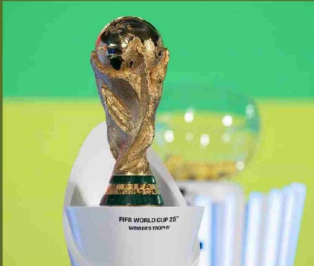
La Copa Mundial de la FIFA tendrá por primera vez tres sedes diferentes: Estados Unidos, México y Canadá.