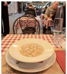
VIA DEGLI ORIFICI. Aquí encuentra a Mattarello y su sopa con capeletti .

Como turistas despistados, recién arribados desde el aeropuerto Guglielmo Marconi, entramos hambreados al primer local que parecía algo hipster (bonito logo, juventud en polera atendiendo), el Alegra . Allí nos encontramos con algo que ya sabíamos: que pedir pasta delgada con salsa boloñesa es una lesera. Como mínimo, unos tagliatelles planitos, para que ayuden