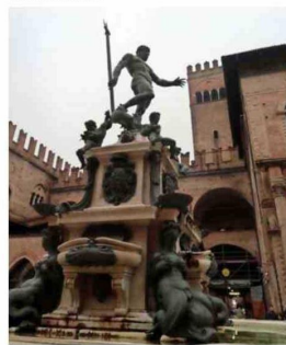
NEPTUNO. Cerca de esta fuente, el bar Vittorio Emanuele tiene un maravilloso tiramisú.

Para bajar la comida de la Taberna de la Osa (traducción), uno puede ir parando en alguna de las cremerías, lugares de venta de helados, o darse una vuelta por el Mercato delle Erbe , donde en horarios tempranos uno puede hacerse de algunas aceitunitas marinadas o de alguna fruta para no abusar tanto de los platos tan engordadores de la ciudad. La grassa ... ¿no?