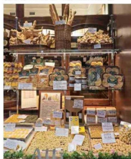
PASTA, PASTA, PASTA. Los capeletti se comen con salsa parmesana o en sopa, al brodo.

apanada, bañada con parmesano. Fea pero rica, se advierte. Se diferencia mucho de la milanesa porque se cuece antes de freírse. Y se nota la diferencia. Es suavecita. Con papas fritas, realmente valió volver. De postre, una panna cotta con fragole , o sea, ese flan de “crema cocida” con una salsa de frutillas.