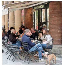
VIA DELL'INDIPENDENZA. Los fines de semana se vuelve peatonal.

apanada, bañada con parmesano. Fea pero rica, se advierte. Se diferencia mucho de la milanesa porque se cuece antes de freírse. Y se nota la diferencia. Es suavecita. Con papas fritas, realmente valió volver. De postre, una panna cotta con fragole , o sea, ese flan de “crema cocida” con una salsa de frutillas.