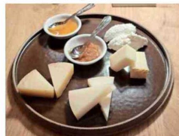
FACTURA PROPIA. Quesos del restaurante Zivieri, una de las novedades del momento.