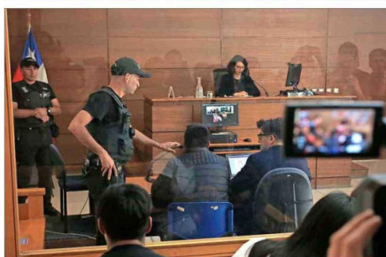
AUDIENCIA. —El presunto autor fue formalizado ayer en Valparaíso.