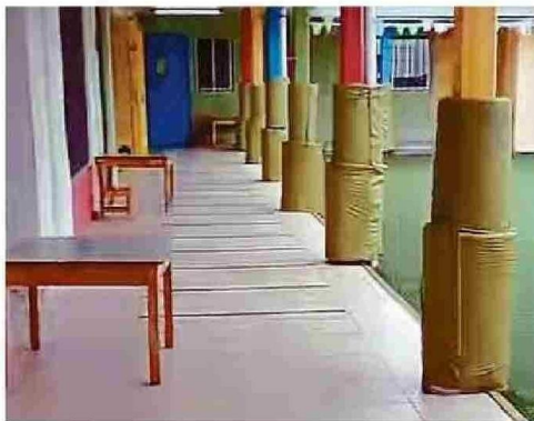
EL RATÓN CORRIÓ POR EL PATIO Y SE ESCAPÓ POR UN DESAGÜE.

y niñas, tanto en edad para sala cuna como jardín infantil, para recibir educación parvularia (...)"