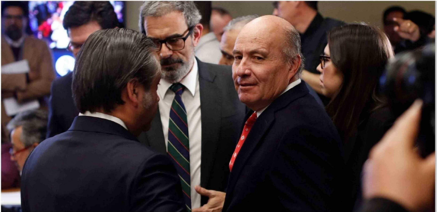
► Jorge Quiroz, ministro de Hacienda.