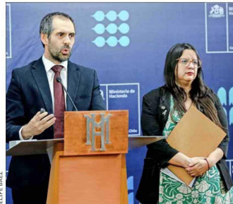
El ministro de Hacienda, Nicolás Grau, y la directora de Presupuestos, Javiera Martínez, anunciaron la creación de una comisión que proponga cambios en la fracción del PIB que se recauda por impuesto a la renta.

EN CONTROL DE CONSTITUCIONALIDAD DEL PROYECTO DE LEY DE REAJUSTE: