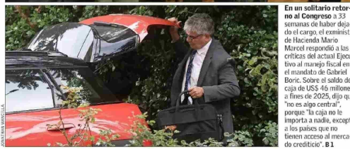
En un solitario retorno al Congreso a 33 semanas de haber dejado el cargo, el exministro de Hacienda Mario Marcel respondió a las críticas del actual Ejecutivo al manejo fiscal en el mandato de Gabriel Boric. Sobre el salto de caja de US$ 46 millones a fines de 2025, dijo que "no es algo central", porque "la caja no le importa a nadie, excepto a los países que no tienen acceso al mercado crediticio". B 1