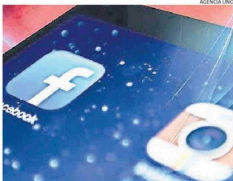
PIDEN NO DEJAR DE LADO LA VIOLENCIA DIGITAL.

Pablo Martínez Tizka cronica@estrellaconce.cl