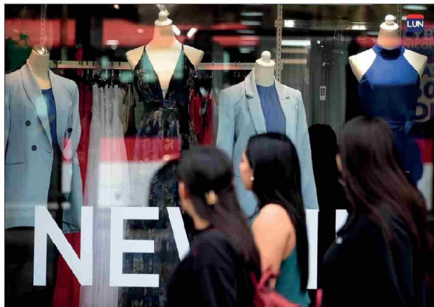
Las personas tienen más tiempo los sábados para darse el placer de comprar.

Sebastian Goldsack, académico de la Facultad de Comunicaciones