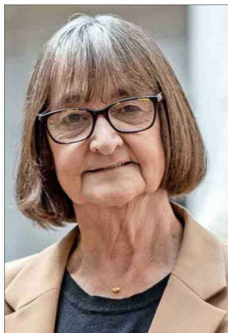
Rosa Devés, rectora de la U. de Chile desde 2022.

En el caso de la U. de Santiago, indican que el impacto sería inmediato, puesto que el 1 de enero de 2027 deberían pagar al menos $3.400 millones por la salida de