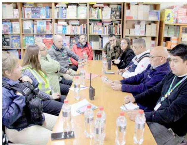
Las autoridades valoraron la realización de esta actividad desarrollada en el tradicional establecimiento curicano.