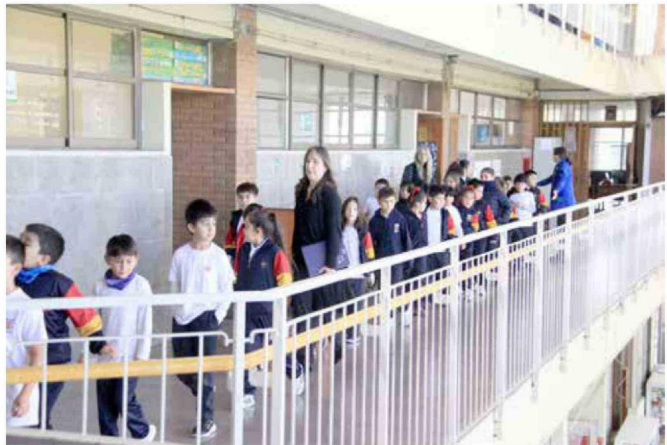
Los alumnos evacuaron tranquilamente en este simulacro ejecutado en Escuela España de Curicó.

“Ha sido un acierto la ejecución de esta actividad, sobre todo considerando que somos un país sísmico. Para lo cual, es necesario estar preparados y así entregar las respuestas adecuadas”, aseveró el docente.