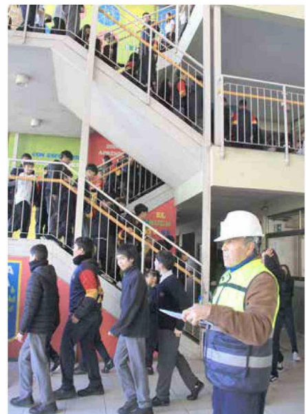
Las escaleras del establecimiento no generaron problemas al momento de bajarlas.