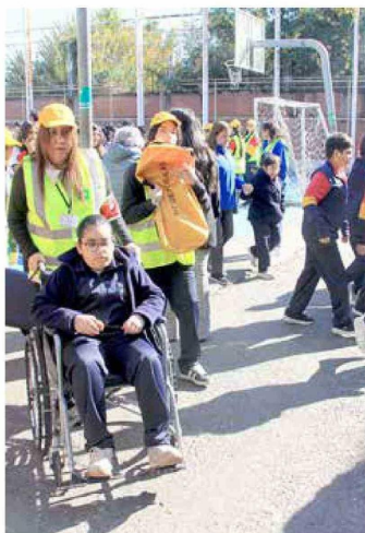
También los menores con discapacidad fueron incorporados en este ejercicio.