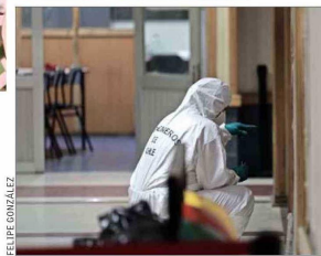
SEGUNDO ATAQUE. — En el primer piso, dispararon al grupo que auxiliaba al herido.

Insistió en que “esto no es un caso aislado y al tener una balacera dentro del colegio, ya no tenemos seguridad para nuestros hijos”, y que, por esta situación, los propios apoderados decidieron