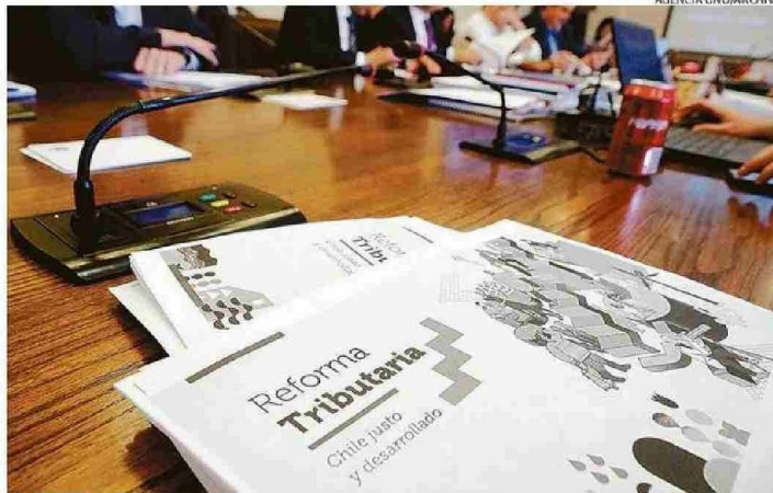
ADVIERTEN QUE EL CONTEXTO ECONÓMICO MUNDIAL NO FAVORECERÍA LA IMPLEMENTACIÓN DE UNA REFORMA.

Agregó que hoy la inversión privada requiere señales