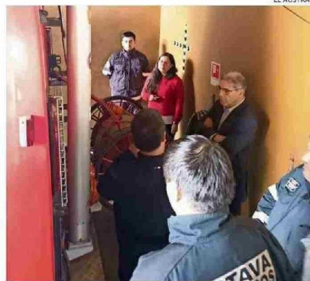
EMPRESARIOS CONOCIERON EL CUARTEL Y REALIZARON LA DONACIÓN.