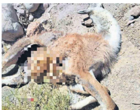
LOS ANIMALES BLANCOS DEL ATAQUE SON CAMÉLIDOS Y OVEJAS.