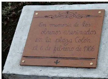
PLACA QUE RECUERDA A LOS CAÍDOS EN LA MASACRE DE ANTOFAGASTA.

asambleas populares del Partido Demócrata”.