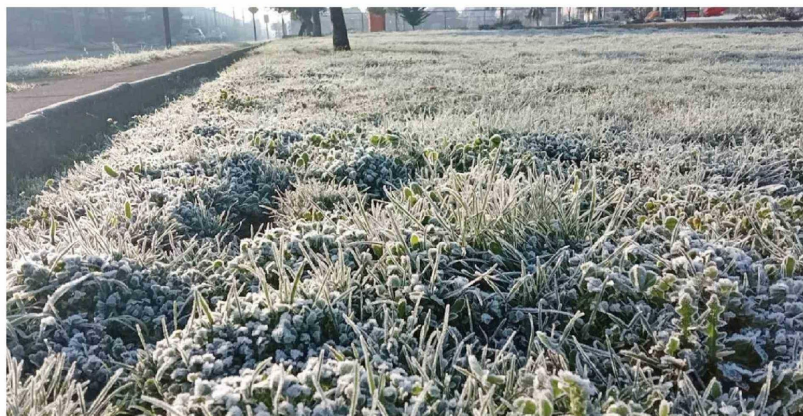
LA MADRUGADA DE ESTE MARTES, los registros llegaron hasta los -2°C en sectores cercanos a la ciudad de Los Ángeles.

De acuerdo con las proyecciones meteorológicas, las bajas temperaturas continuarán durante gran parte de esta semana en la provincia de Biobío, aunque con un leve ascenso hacia el fin de semana. Mientras tanto, las autoridades reiteraron la importancia de adoptar medidas de autocuidado y mantenerse informados sobre las condiciones climáticas.