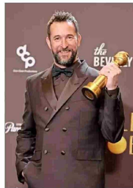
Noah Wyle, Mejor Actor en una Serie Dramática por "The Pitt".