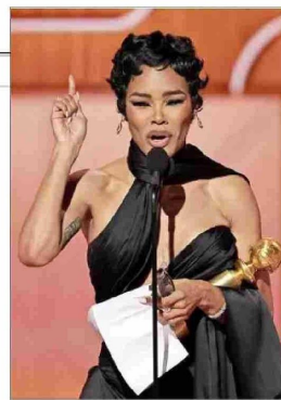
Una emocionada Teyana Taylor, ganadora por "Una batalla tras otra".

Timothée Chalamet triunfó por su aplaudido rol en "Marty Supremo", de Josh Safdie, que llega a la cartelera local el 5 de febrero.