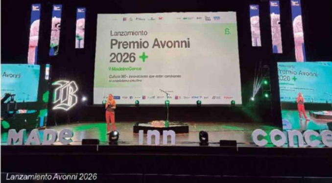
Lanzamiento Avonni 2026

En el marco del MadeInnConce se realizó el lanzamiento de los Premios Avonni 2026, que congregó a representantes del ecosistema de emprendimiento e innovación local. Este galardón, entregado hace 20 años por Foroinnovación por encargo del Ministerio de Ciencia, Tecnología, Conocimiento e Innovación y co organizado por El Mercurio y TVN, destaca proyectos que están aportando desde distintas áreas al desarrollo sostenible del país. Esta gira de lanzamientos regionales es posible gracias al apoyo de SKY Airline, aerolínea que conecta a Foroinnovación con