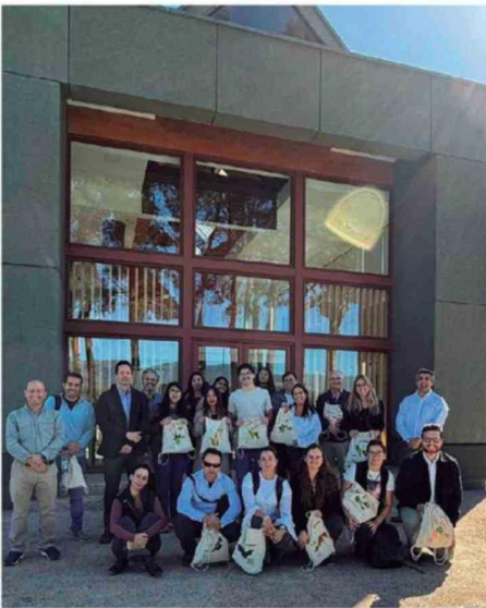
Visita a Bioforest de Arauco.