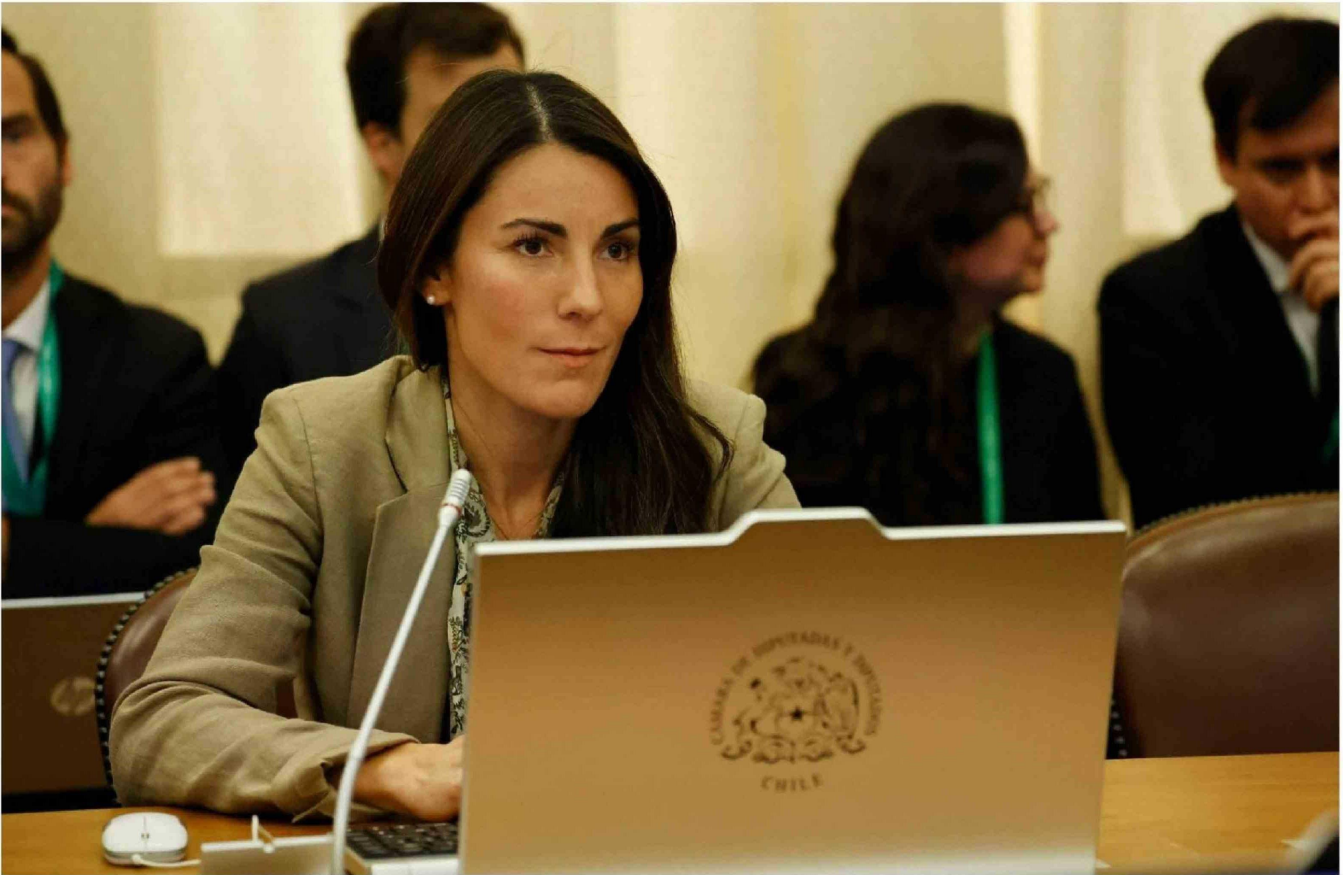
► María Paz Arzola, ministra de Educación, en la Cámara de Diputados.