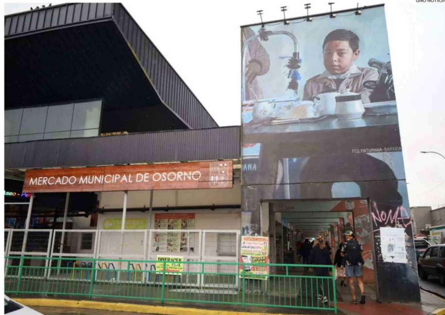
LOS LOCATARIOS ESPERAN QUE LOS NUEVOS NEGOCIOS MANTENGAN LA IDENTIDAD QUE CARACTERIZA AL RECINTO.

"Nuestro recinto tiene historia y nos preocupa que las licitaciones caigan en manos de personas que lleguen a ocupar los locales con productos que revenden, lo que se convierte en competencia desleal para quienes los producen y ven-