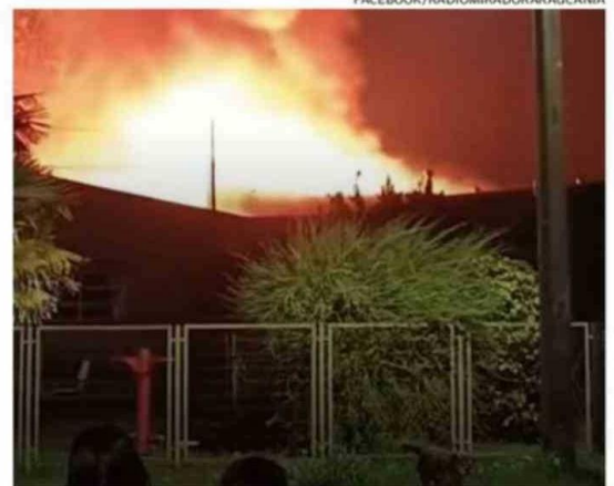
VARIAS SALAS RESULTARON DESTRUIDAS POR LAS LLAMAS.