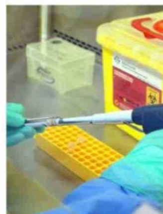
SE INVESTIGAN LOS LUGARES DE RIESGO ASOCIADOS AL CONTAGIO.