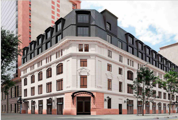
El proyecto Huérfanos 801 es desarrollado por BiceVida, aseguradora de la familia Matte.

Empresarios y arquitectos cuentan cómo han podido conjugar la remodelación o reconversión de verdaderas "joyitas" en Santiago Centro y el sector oriente (Providencia, Las Condes) a partir de una actividad rentable o al menos sustentable.