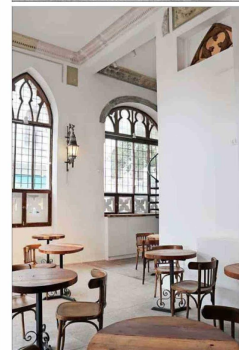
La Casa Larraín se ubica en Alonso de Ovalle con San Ignacio y fue construida en 1906, cuando el arquitecto tenía 26 años.