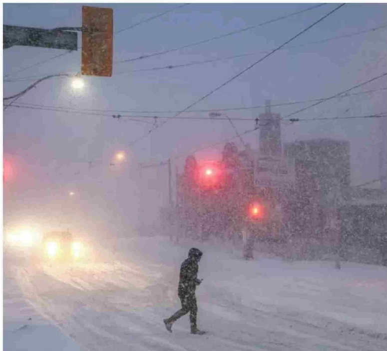
Tormentas. Gente camina por el centro de Toronto mientras una tormenta invernal pasa por la región.

Frío Las intensas nevadas detuvieron el tráfico, cancelaron vuelos y provocaron la cancelación masiva de clases el lunes.