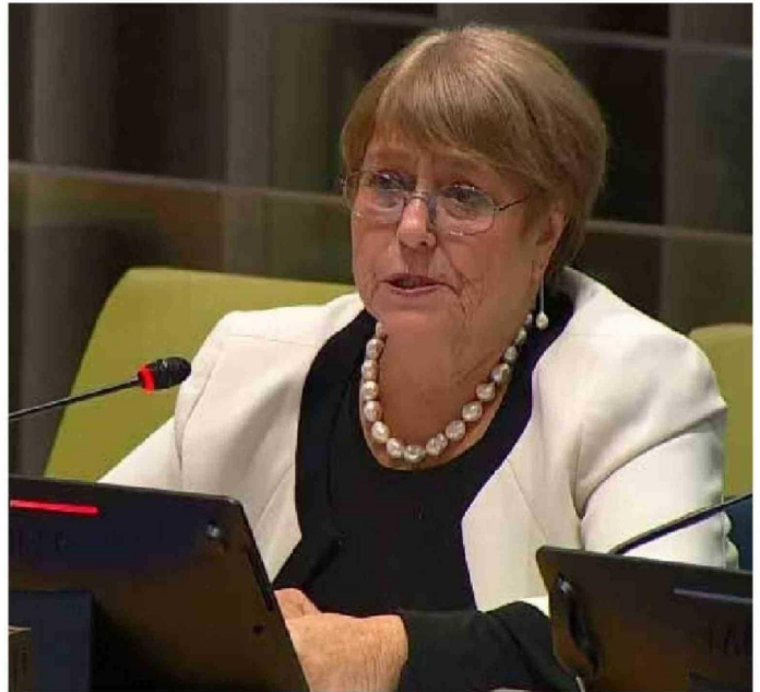
► La expresidenta Michelle Bachelet continúa con su candidatura a la Secretaría General de Naciones Unidas.

En una carta dirigida al presidente de la Cámara de Diputados, Jorge Alessandri, piden oficiar al ministro de Relaciones Exteriores, Francisco Pérez Mackenna, sobre la supuesta acción de desprestigio de la postulación de la exmandataria.