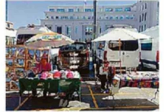
BENEFICIADOS SON DE LA COMUNA.