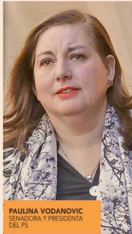
PAULINA VODANOVIC SENADORA Y PRESIDENTA DEL PS

La senadora opositora independiente Alejandra Sepúlveda da cuenta de la preocupación que le genera la