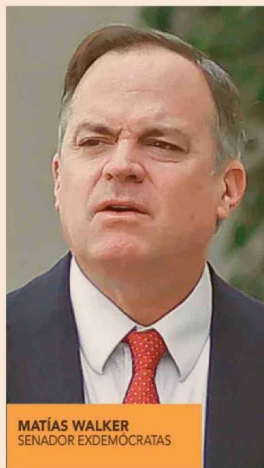
MATÍAS WALKER SENADOR EXDEMOCRATAS

aplicación eventual de la invariabilidad tributaria por 25 años y advierte que "si estamos hipotecando el país, necesitamos tiempo para estudiar el proyecto y para escuchar a las personas que entienden los temas".