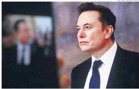
ELON MUSK TRABAJA EN BABY GROK XAI.

mucho que ver, según los académicos, con el fomento a las comparaciones entre personas, además de que acaparan mucho tiempo y horas de sueño, y sus algoritmos amplifican los contenidos nocivos.