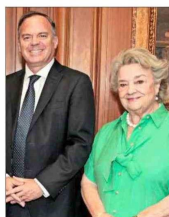
Matías Walker, vicepresidente del Senado, y Lucía Santa Cruz.