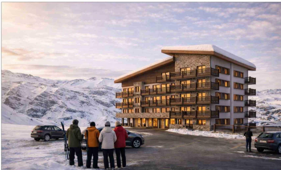
En el nuevo complejo, las viviendas más pequeñas miden 55 metros cuadrados y el precio de dos noches para dos personas bordea los $4.900.000.

Aunque cada espacio tiene su propia cocina, se ofrece servicio de