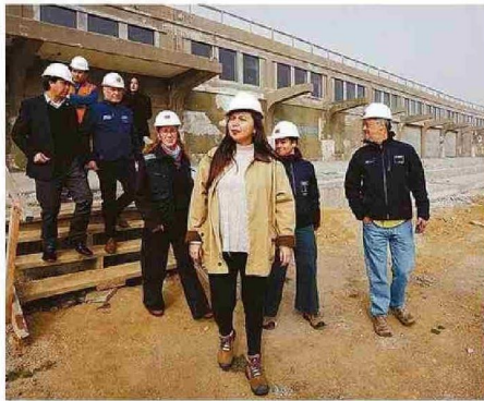
AUTORIDADES COMUNALES Y REGIONALES LLEGARON AL LUGAR.