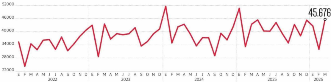
Evolución mensual En número