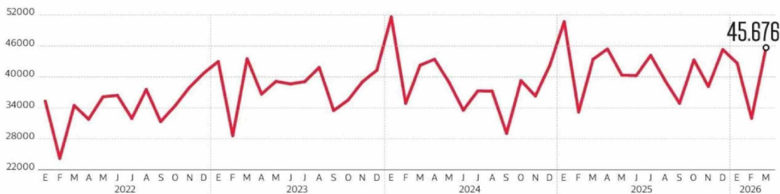
Evolución mensual En número