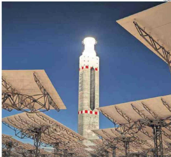
LA TORRE PRINCIPAL, DE CERRO DOMINADOR, DE 150 METROS, ES UNA DE LAS ESTRUCTURAS MÁS ALTAS DEL PAÍS.

Cuenta con una capacidad de 110 MW en su planta termosolar, gracias a sus 10.600 espejos (heliostatos) repartidos en una superficie de 700 hectáreas, que reflejan la luz del sol, concen-