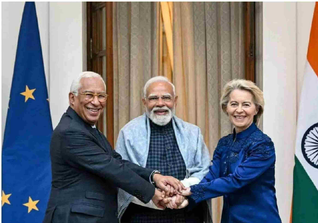
► Presidente del CE, António Costa, el primer ministro de la India, Narendra Modi, y la presidenta de la UE, Ursula von der Leyen.

Luego de 20 años de negociaciones, el bloque y el país más poblado del mundo llegaron a un acuerdo "acelerado" por las amenazas y aranceles de Donald Trump y el dominio de las exportaciones de China.